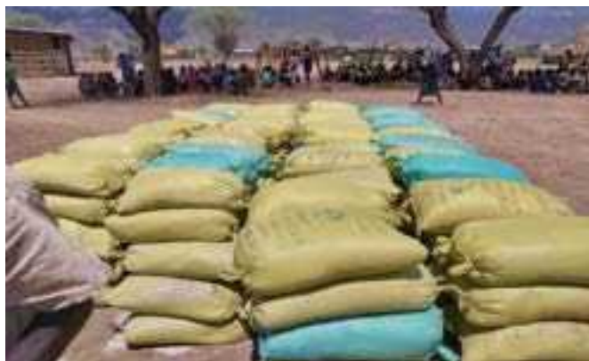
ደቡብ ኦሞ በናጸማይ በድርቅ ለተጎዱት የተደረገ ማህበራዊ ድጋፍ