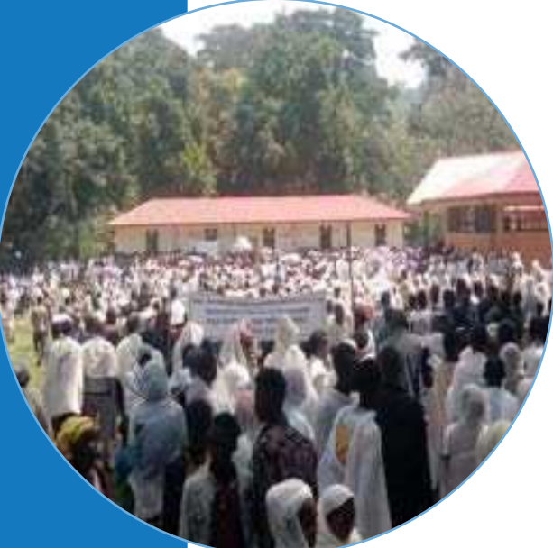
የአብነት ት/ት ቤቱ ምረቃ