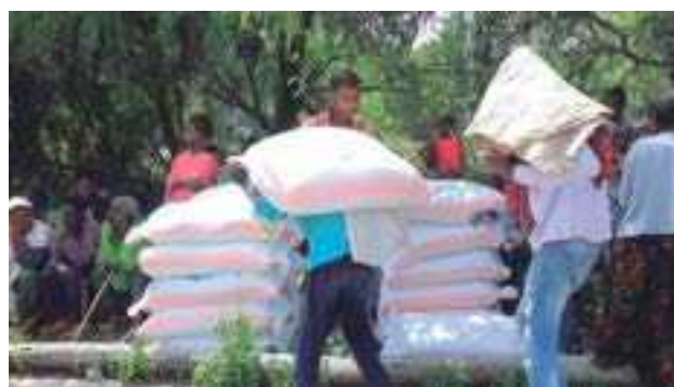
ሰቆጣ ለሚገኙ ከወለጋ ለተፈናቀሉ ወገኞች የተደረገ ድጋፍ