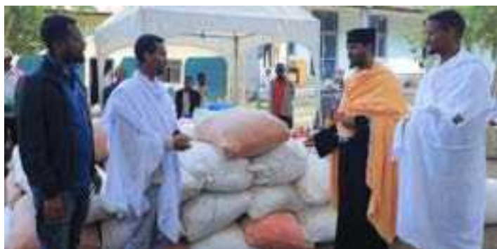
ስልጤ ዞን ቅበት ተፈናቅለው ቡታጅራ ማርያም ይገኙ ለነበሩ ተፈናቃዮች የተደረገ ድጋፍ።