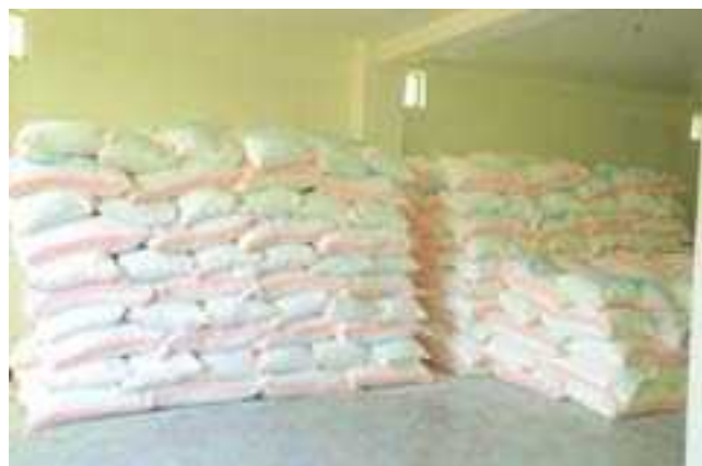
ሰቆጣ ለሚገኙ ከወለጋ ለተፈናቀሉ ወገኞች የተደረገ ድጋፍ