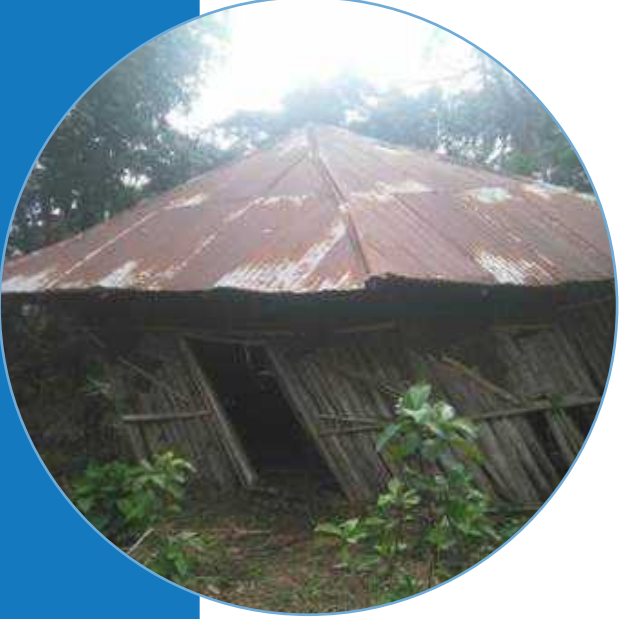
አብነት ት/ት ቤቱ በተሠራበት ቦታ ቀድሞ የነበረ ቤተ ክርስቲያን

በዋና ማእከል አስተባባሪነት በሰሌዳ ፍፍ ወረዳ ቤተ ክህነት የሳርዶ ማርያም የብጹዕ አቡነ ሚካኤል (ዶ/ር) መታሰቢያ አብነት ትምህርት ቤት ከ 4 ሚሊዮን ብር በላይ በሆነ ወጪ ተገንብቷል። በሀገረ ስብከቱ ከሚገኙት ከ380 በላይ አብያተ ክርስቲያናት ውስጥ 179ኙ ብቻ በቂ መንፈሳዊ አገልግሎት የሚሰጥባቸው ሲሆኑ፣ 141ዱ አንድ ቁስ እና ዲያቆናት ብቻ ያሏቸው በመሆናቸው ቅዳሴ የማይካሄድባቸው እና 60ው ደግሞ ጭራሹኑ ተዘግተው የሚገኙ አብያተ ክርስቲያናት ናቸው። ሀገረ ስብከቱም ሰፊ ሲሆን፣ በተለይ ከመቼ ከተማ በስተቀር ሌሎች በገጠር በሚገኙ ትንንሽ ከተሞች ያሉት አገልጋዮች ጥቂት ከመሆናቸውም በተጨማሪ ከሰሜኑ የሀገራችን ክፍል የሚመጡ ስለሆነ የአካባቢውን ቋንቋ(አሮምኛ) ተናጋሪ ባለመሆናቸው ወንጌል አስተምሮ እና ስብከ ምእመኑን በሃይማኖቱ እንዲጸና ማድረግ ላይ ባሉ ውስንነቶች መግባባት ስለሚያቅታቸው ብዙም ሳይቆዩ ገሚሶቹ ጥለው ይሄዳሉ። የቀሩትም ቢሆን ከሥርዓተ ቅዳሴ ውጪ ሌሎች መንፈሳዊ አገልግሎቶችን ለምእመኑ መስጠት አይችሉም። በዚህም ምክንያት ምእመናን በቂ መንፈሳዊ አገልግሎት ስለማያገኙ፣ ሃይማኖታቸውን ባለማወቃቸው እና ኑሯቸውም ዝቅተኛ በመሆኑ በየጊዜው በትንሽ ጥቅማ ጥቅም እየተደለሉ ከእነልጆቻቸው ወደ ሌላ እምነት እየሄዱ ይገኛሉ። ይህ ችግር በዚህ ከቀጠለ ወደ ፊት የሚፈጠረውን ችግር በማሰብ የተሠራው ይህ አብነት ትምህርት ቤት ወደ ሥራ የገባ ቢሆንም በሙሉ ዓቅሙ ፍሬ እንዲያፈራ የመምህራን፣ የቀስ እና የበጀት ድጋፍ ይፈልጋል።