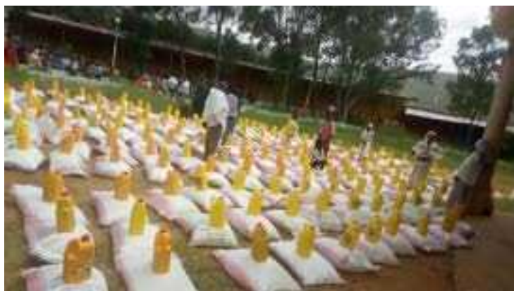
ከሰሜን ሸዋ ሰላሌ ፍቼ ሀገረ ስብከት የተለያዩ ወረዳዎች ለተፈናቀሉ 40 ካህናት የተደረገ ድጋፍ።