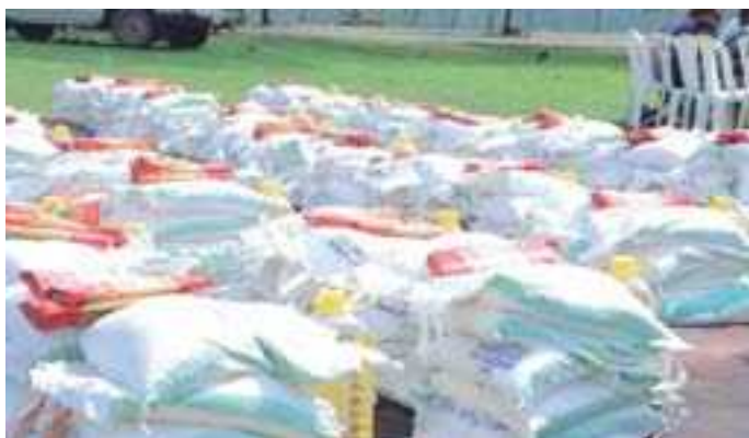
ከሰሜን ሸዋ ሰላሌ ፍቼ ሀገረ ስብከት የተለያዩ ወረዳዎች ለተፈናቀሉ 40 ካህናት የተደረገ ድጋፍ።